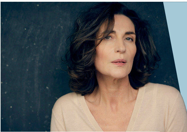
VÉRONIQUE GENS soprano

Tras destacar en la escena barroca durante más de una década, Véronique Gens se ha labrado una sólida reputación internacional en otros ámbitos y es considerada una de las mejores intérpretes de Mozart. Su repertorio incluye sus grandes papeles (doña Elvira, condesa de Almaviva, Vitellia, Fiordiligi, etc.), y otros como Ifigenia en Táuride , Ifigenia en Áulide o Alceste . En ámbitos diversos, ha interpretado Alice Ford ( Falstaff ), Eva ( Los maestros cantores de Núremberg ), Madame Lidoine ( Diálogos de los Carmelitas ), Helena ( La bella Helena ) y Missia Palmeri ( La viuda alegre ).