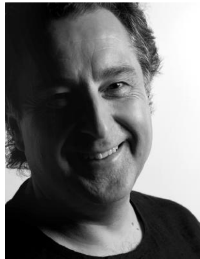
JOSEP PONS DIRECTOR

Bajo el influjo encantador de los Ländler —danza popular de ámbito germano a finales del siglo XVIII—, la sinfonía se cierra con el “Finale”, donde volvemos al trémolo de cuerdas y a un diálogo con los instrumentos de viento madera, lleno de contrastes y tensión que caen en la plácida trompa que nos devuelve la armonía y la serenidad.