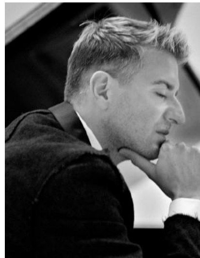
JEAN-YVES THIBAUDET PIANO

En 1999, Josep Pons recibió el Premio Nacional de Música del Ministerio de Cultura español, en reconocimiento a su amplio y extraordinario trabajo en favor de la música del siglo XX, así como por la calidad de sus interpretaciones y programación única.