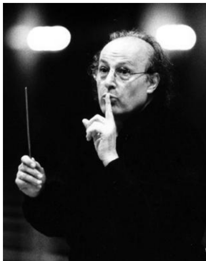
ELIAHU INBAL DIRECTOR

Nacido en Israel, Eliahu Inbal empezó sus estudios en la Academia de Jerusalén, prosiguiendo luego en París, Hilversum y Siena con Franco Ferrara y Sergiu Celibidache. Desde que ganó, a la edad de 26 años, el Primer Premio en el Concurso de Dirección Cantelli, Eliahu Inbal empezó su carrera dirigiendo muchas de las grandes orquestas de Europa, de los Estados Unidos y de Japón, participando además regularmente en Festivales internacionales.