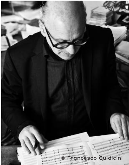
MICHAEL NYMAN COMPOSITOR